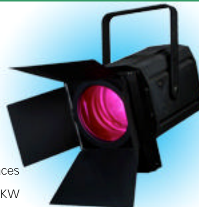
NOVA/CS2 et volet 4 faces montés sur PC 2KW