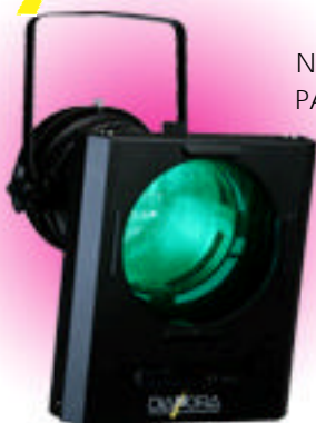
NOVA/CS2 monté sur PAR64